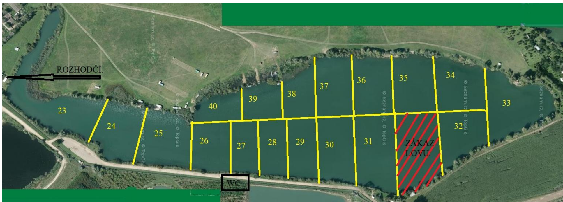
Obr. 2: Mapa lovného úseku Bezedné se zakreslením a označením jednotlivých lovných sektorů.