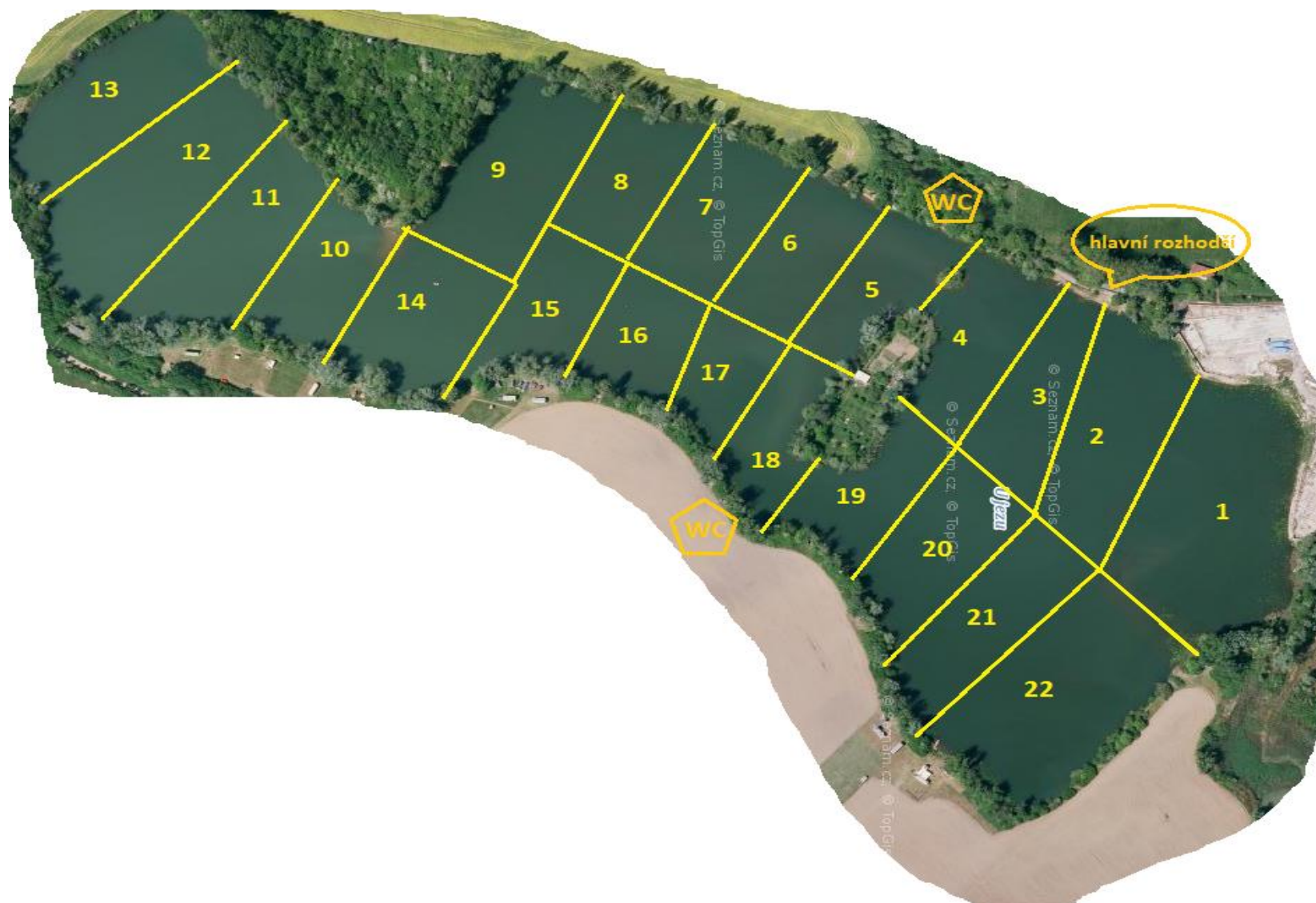
Obr. 1: Mapa lovného úseku U jezera se zakreslením a označením jednotlivých lovných sektorů.